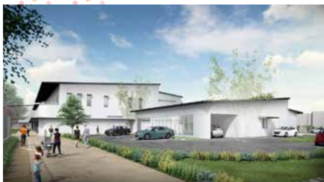
休日・夜間急患診療所