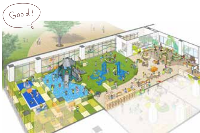
こども館内プレイルーム

他にも、中高生などの利用を想定した音楽スタジオや軽体育室などが設置されます。 石原児童クラブでは約1200人の児童保育を行います。