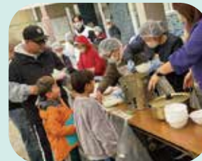
11/9 自主防災会 (本石二丁目自治会連合会)