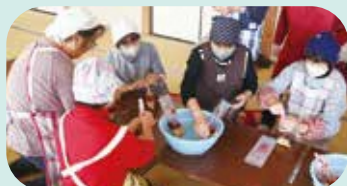
11/21 大里分団炊出訓練

炊き出しを配布する場面では、大きな鍋を囲んで地域のみなさんと笑顔で言葉を交わし、どこかホッとする和やかな空気も広がりました。