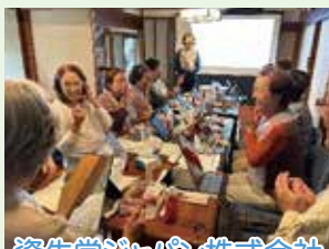
資生堂ジャパン株式会社