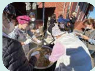
11/15 防災訓練 (太田地区自主防災会)

災害発生時に、迅速に地域のみなさまへ温かい食事を届けられるよう、各分団で炊き出し訓練を行いました。訓練中は真剣な表情で取り組む団員の姿が見られ、本番さながらの緊張感が漂いました。