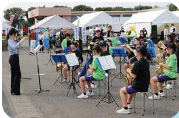
富士見中学校吹奏楽部の演奏