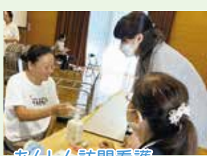
あんしん訪問看護 リハビリステーション