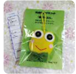
▲交通安全マスコット「無事カエル」

今後もその伝統を受け継ぎ、地域や社会に貢献できる活動を続けていきたいと考えています。