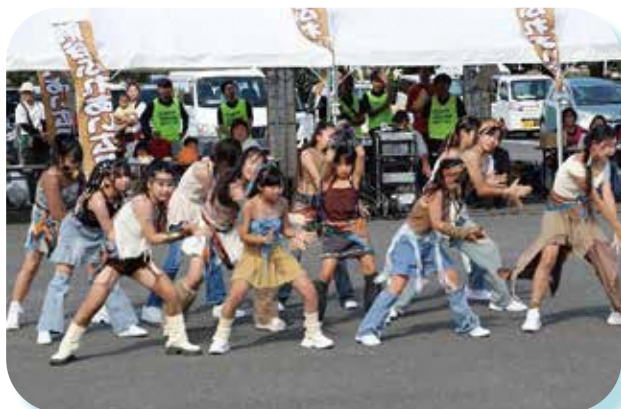
street dance studio AXENT の ダンスパフォーマンス