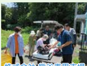
株式会社 熊谷青果市場