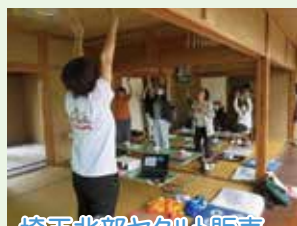
埼玉北部ヤクルト販売 株式会社