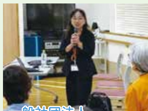
一般社団法人 日本医食同源研究所