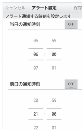
アラート設定 ごみ収集日を設定した時間にお知らせします。