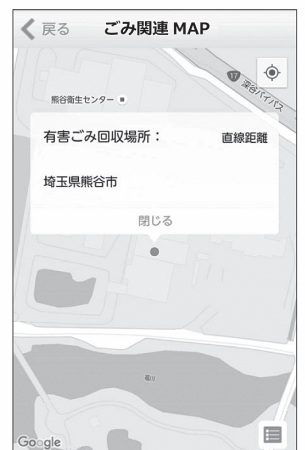
ごみ関連MAP 有害ごみの回収場所等を現在地から探せます。