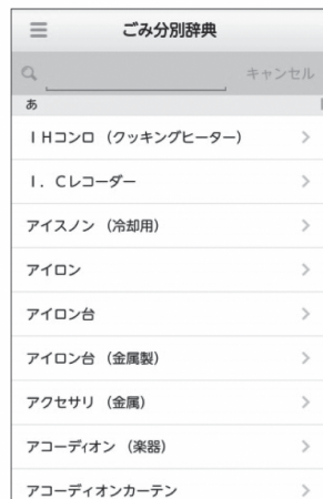
ごみ分別辞典 ごみの分別について確認することができます。