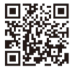
デジタルミュージアム ホームページ

とき 夏季に行われる無形民俗文化財の開催状況については熊谷デジタルミュージアムの「伝統行事」ページをご参照ください。各保存会への連絡先は江南文化財センターまでお問い合わせください。