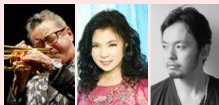
日野皓正 (トランペッター) 八代亜紀 (シンガー) 熊谷和徳 (タップダンサー)