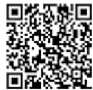
人事院ホームページ