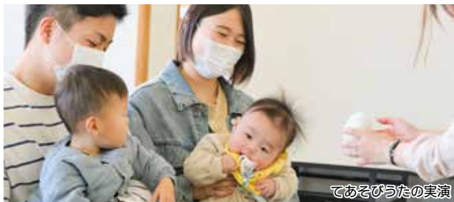
てあそびうたの実演