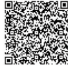
電子申請・届出サービス

申込み 左記コードまたは、往復ハガキ（1人1通）に参加者の郵便番号・住所・氏名・電話番号を明記し、2月21日（水）（必着）までに左記へ。