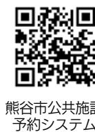
熊谷市公共施設予約システム

公共施設の利用予約がオンラインで可能です。(一部施設除く) 2月からは利用者登録もオンラインで可能になり、一層便利になります。ご予約の際はぜひ、