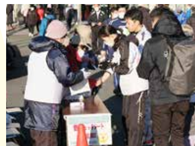
めめま駅伝ボランティアの様子

では「実践」、「応援」、「協力」を合言葉にだれもが元気に生き生きと生活できるまちづくりを目指しています。