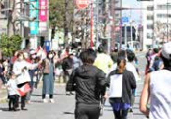
▲ 熊谷さくらマラソン大会