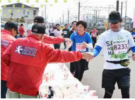
▲ 熊谷さくらマラソン大会ボランティア