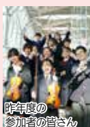
昨年度の参加者の皆さん