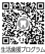
生活歯援プログラム