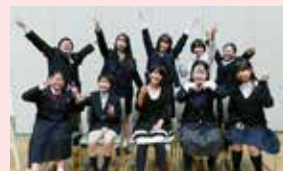
昨年度の参加者の皆さん