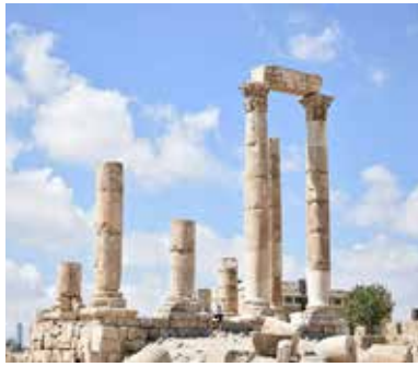
首都アンマンの遺跡

生活をし、平和を願っています。ヨルダンの名所といえばペトラ遺跡や死海が有名ですが、首都アンマンにある遺跡やワディラム砂漠もおすすめ！雄大な自然と歴史を感じられる場所です。