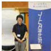
派遣前訓練 (二本松訓練所/福島県)

私も「きっかけ」を与え、誰かの挑戦を後押しできる先生になれるよう、試行錯誤を続けていきたいと思つています！