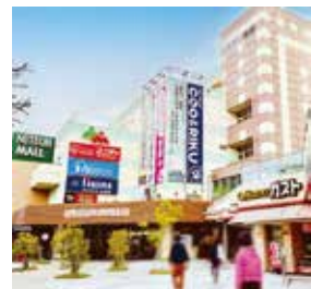
店舗外観 画像はイメージです。