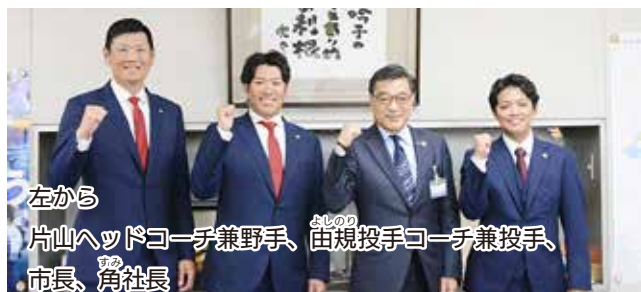
左から 片山ヘッドコーチ兼野手、 あしのり 宙規投手コーチ兼投手、 市長、 あまの 角社長

3月25日～31日、熊谷ラグビー場で第24回全国高等学校選抜ラグビーフットボール大会が開催され、桐蔭学園（神奈川）の優勝で幕を閉じました。