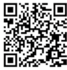
県立図書館ホームページ

とき 4月7日(金)・14日(金)・21日(金)・27日(木) 14時～ ところ 鑑賞室 内容 「まく子」(劇映画・カラー・108分)ほか 定員 20人(先着順、状況により変動する可能性あり) ※費用無料、申込み不要 ※そのほかの上映作品については、下記コードからご確認ください。 ◆県立熊谷図書館 TEL 048-523-6291