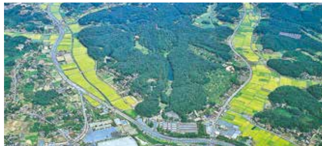
典型的な谷津地形（国営武蔵丘陵森林公園上空より）