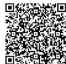
市ホームページ (病児・病後児保育)