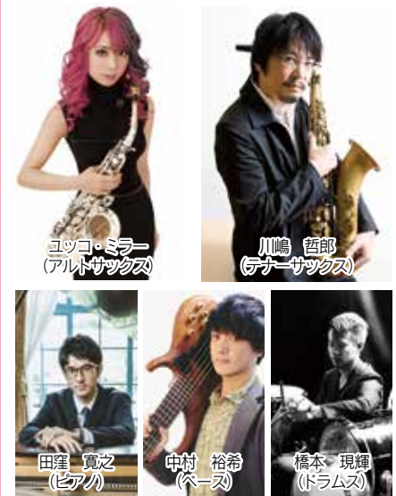
ユッコ・ミラー (アルトサックス)