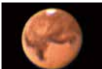
2003年大接近中の火星