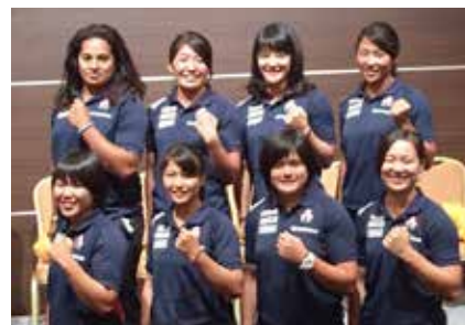
ワールドカップの出場を目指すアルカス熊谷の選手たち