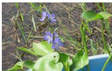
ミズアオイ(別府沼の貴重な植物)