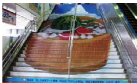
昨年の実施例(熊谷駅正面口)

・籠原駅北口西階段は、「中学生以下の部」として中学生以下の方の作品を優先的に展示します。