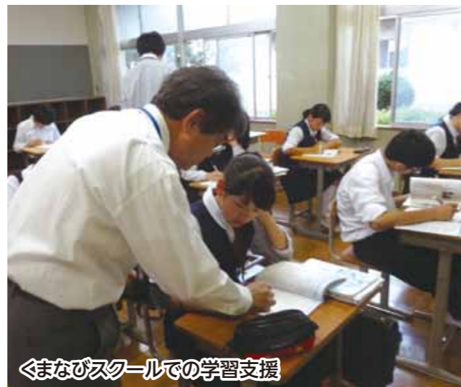
くまびスクールでの学習支援

また、生きる力を育むための土台として、「熊谷の子どもたちは、これができる！」「4つの実践」と「3減運動」に引き続き積極的に取り組めます。大人が手本となり、学校・家庭・地域が一体となって推進していきます。引き続き、ご協力をお願いします。