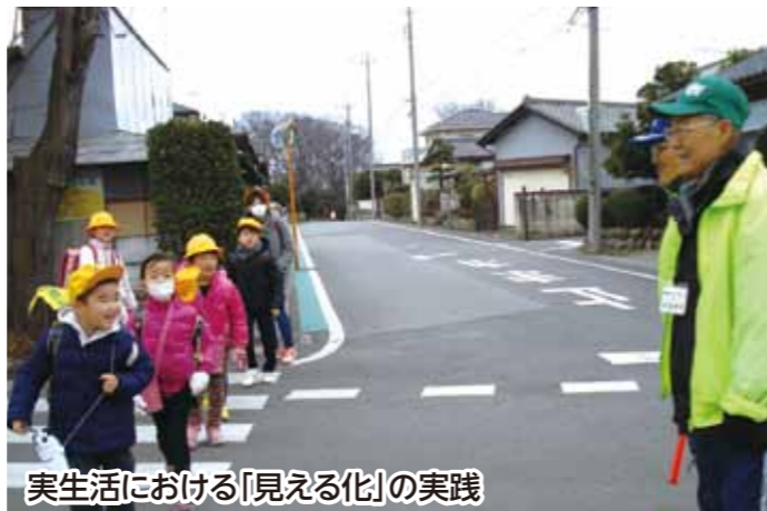
実生活における「見える化」の実践