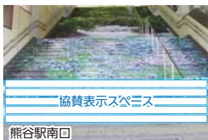
協賛表示スペース