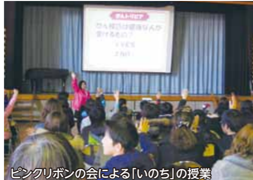
ピンクリボンの会による「いのち」の授業