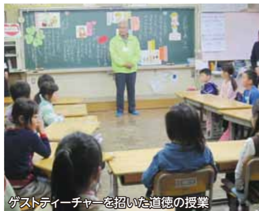
ゲストティーチャーを招いた道徳の授業

子供たちが変化の激しいこれからの社会を生きるため、「確かな学力」を身に付け、生きる力を育む教育の推進に取り組み、引き続き、学力日本一を目指します。本市では、一般的な学力調査によって測定できる、いわゆる「知力」だけを学力とは捉えていません。思いやりの心などの「徳力」や、走力や投力などの「体力」も、広い意味での学力であり、「知・徳・体」のバランスのとれた力、これを学力と捉え、子供たち一人一人の学力を伸ばしていくために、各学校では具体的な取組みを推進します。また、生きる力を育むための土台として、「熊谷の子どもたちは、これができます！」「4つの実践」と「3減運動」に引き続き積極的に取り組みます。大人が手本となり、学校・家庭・地域が一体となって推進していきます。引き続き、ご協力をお願いいたします。