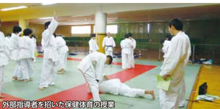
外部指導者を招いた保健体育の授業