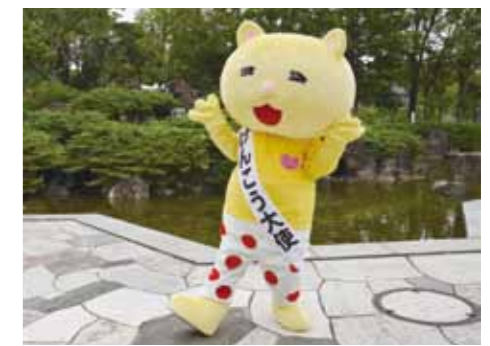
けんこう大使「ニャオざね」