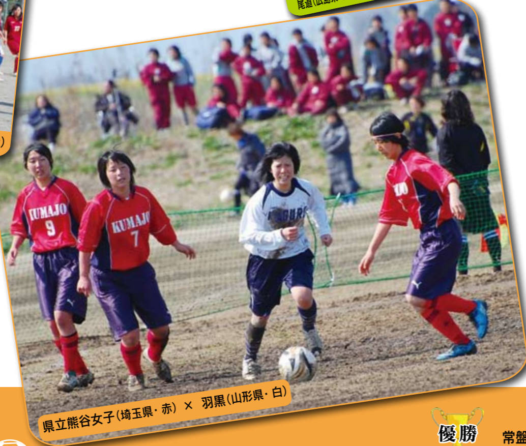
県立熊谷女子(埼玉県・赤) × 羽黒(山形県・白)

全国の強豪と対戦できたためめまカップは、私たちにとって、とても貴重な経験になりました。地元熊谷にこのような大会があることを大変うれしく思っています。