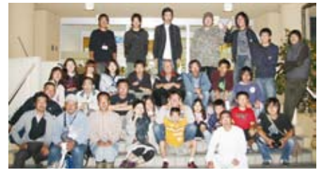
PR映画の出演者やスタッフの皆さん

『すべてが手作りのPR映画』 そのころ熊谷市の合併があ り、我が熊谷の再発見と市民交 流のお手伝いになればと考えた のがPR映画の制作でした。平 成20年度に市の協働事業提案制 度に応募したところ採択してい ただき、市と協働による映画作 りが始まりまし。熊谷出身の たかひろや監督を頼りに、各 地域の商工会、商工会議所、