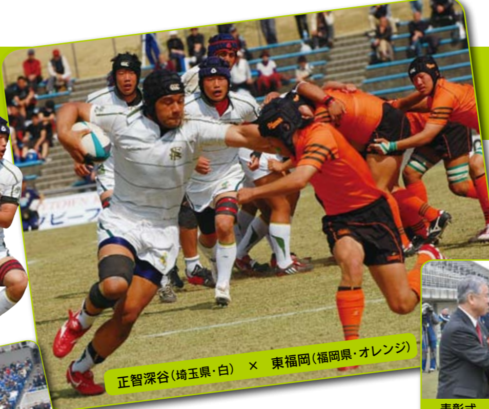
正智深谷(埼玉県・白) × 東福岡(福岡県・オレンジ)