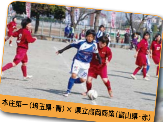
本庄第一(埼玉県・青) × 県立高岡商業(富山県・赤)