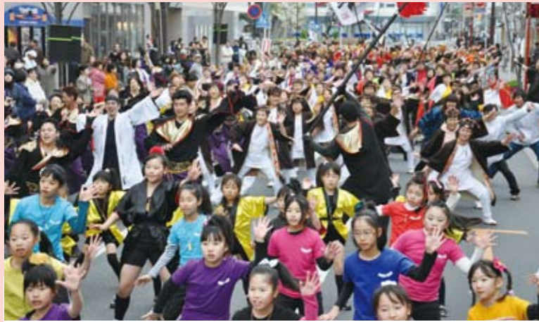
熊谷駅東通りを会場に、県内の14チームによるよさこいの競演が行われました。最後は参加者全員が「総踊り」で締めくくり、沿道からは大きな歓声を送られました。