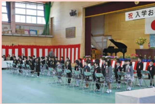
市内の小・中学校で入学式が挙行政され、期待に胸躍らせる多くの新入生たちの新たな学校生活が始まりました。写真は、江南北小学校入学式