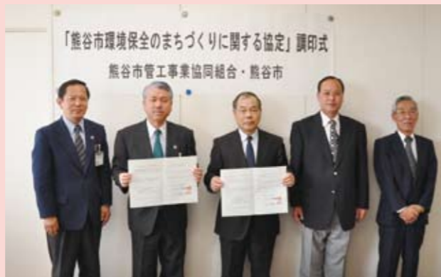
市と熊谷市管工事業協同組合は、今後一層協力して環境保全事業を効果的に推進することができるよう協定を結びました。環境保全のための、団体・企業等との協定は今回が初めてです。