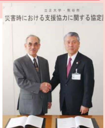
市は、災害時に避難所や救援物資等の集配拠点として大学施設を使用することや、災害時の学生ボランティア募集等の支援に関することについて立正大学と協定を締結しました。