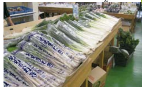
物コーナーという、のぼり旗が目印になっているところもあるの。

とき 11月21日(土)・22日(日) 10時～15時 ところ 熊谷スポーツ文化公園内 (彩の国くまがやドーム、にぎわい広場) 内容 農産物共進会、農畜産物の販売、伝統工芸品の展示・製造実演、商工業製品の展示・販売など ◆農業振興課(妻沼庁舎) ☎048-588-1321