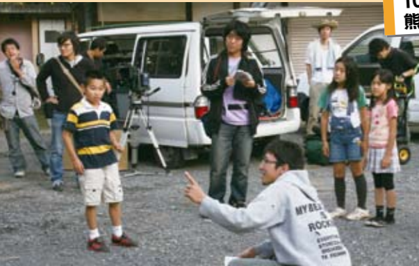
10月10日～12日 熊谷PR映画の撮影

市民活動団体「めぬまチャンネル」と熊谷市の協働事業で制作するPR映画の撮影が行われ、市内各地をロケ隊と出演者が走り回りました。