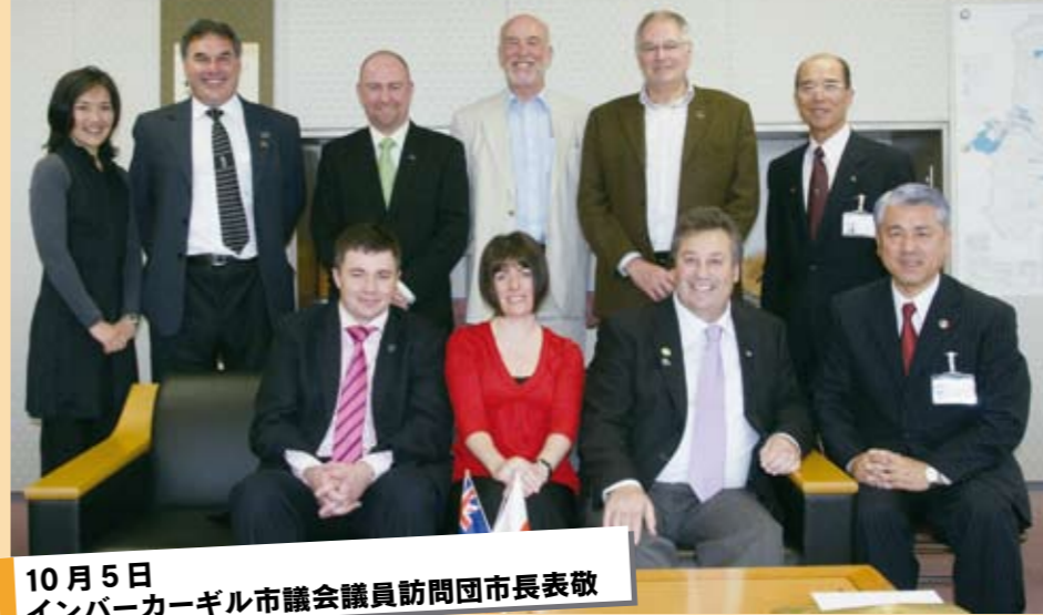
10月5日 インバーカーギル市議会議員訪問団市長表敬

戦争で犠牲になられた方々の慰霊と、世界の恒久平和を願い、追悼式が熊谷会館で行われました。