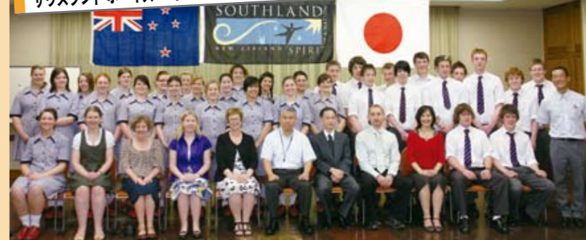
9月24日 サウスランドボーイズハイスクール、サウスランドガールズハイスクールが市長表敬

県立熊谷高校、県立熊谷女子高校とそれぞれ姉妹校提携をしているサウスランドボーイズハイスクール、サウスランドガールズハイスクール(インバーカーギル市)の生徒や関係者が、富岡市長を表敬訪問しました。