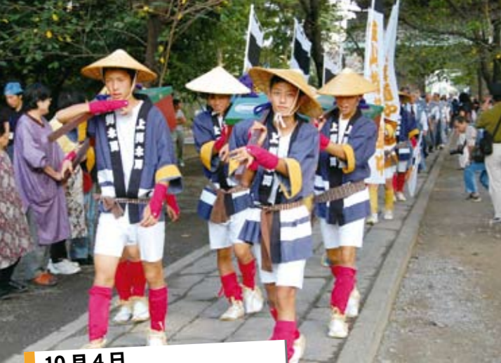
10月4日 太田松茸道中

江戸時代に行われた献上松茸道中を再現し、太田市の大光院から妻沼聖天山まで、当時さながらの格好をした一行が、松茸を運びました。珍しい道中を一目見ようと、妻沼聖天山には多くの見物客が訪れました。