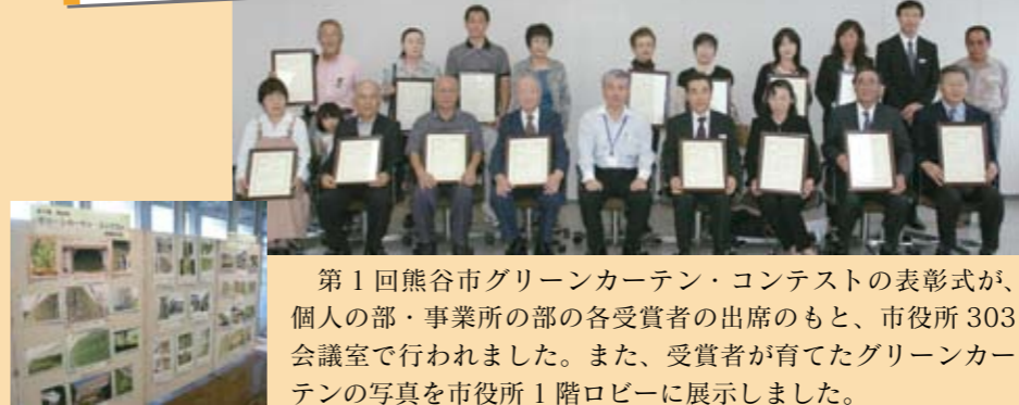
9月30日 第1回熊谷市グリーンカーテン・コンテスト表彰式

第1回熊谷市グリーンカーテン・コンテストの表彰式が、個人の部・事業所の部の各受賞者の出席のもと、市役所303会議室で行われました。また、受賞者が育てたグリーンカーテンの写真を市役所1階ロビーに展示しました。