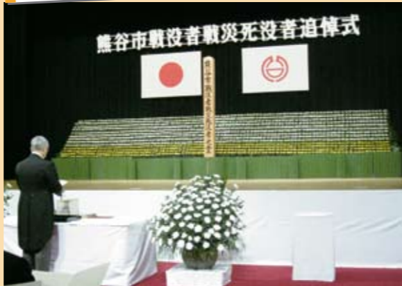
10月9日 熊谷市戦没者・戦災死没者追悼式

戦争で犠牲になられた方々の慰霊と、世界の恒久平和を願い、追悼式が熊谷会館で行われました。