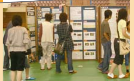
9月26日～28日 小・中学校科学振興展

市民体育館で、夏休みの自由研究など、市内小・中学生の科学研究作品約200点が展示されました。