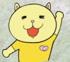
ニャオざね

博士 ところでニャオざねは、熊谷市で、どんな農産物が穫れるのか知っているかのう。 ニャオざね そうだにや、米、小麦、にんじんは知っているにや。その他、なにがあるのかにや? 博士 他にもたくさんあるぞ。大豆、やまといも、ねぎ、かぶ、プロッコリー、栗、ブルーベリーは埼玉県内で作付面積が上位なんじや。それに、ブルーベリーや栗など地域の農産物を使った加工品にも取組んでおる。 ニャオざね 熊谷市って、農業の盛んなところなんだにや。ニャオざねも、熊谷市の農産物が食べたいにや。どこにいったら買えるのかにや。 博士 熊谷市内の直売所やスーパーマーケットなどで販売しておる。くまがや農産