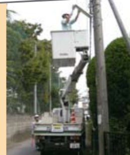
9月26日 防犯のまちづくり協定に基づく防犯灯清掃ボランティア

埼玉県電気工事工業組合熊谷支部の皆さんが、2人一組で市内西部地域の小中学校8校周辺に設置されている防犯灯の清掃を行っていただきました。