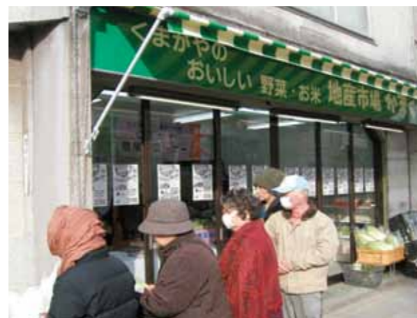
地産市場かまくら