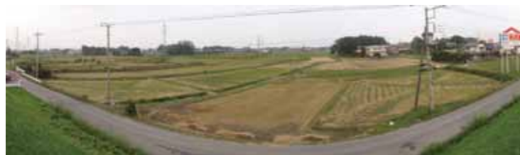
ほ場整備の状況 (熊谷中央地区：上段 施工前/下段 施工後)

これら農業環境の向上のためには、農業者・農業団体、地域住民等と連携し、一体的な整備と保全を図る必要があります。