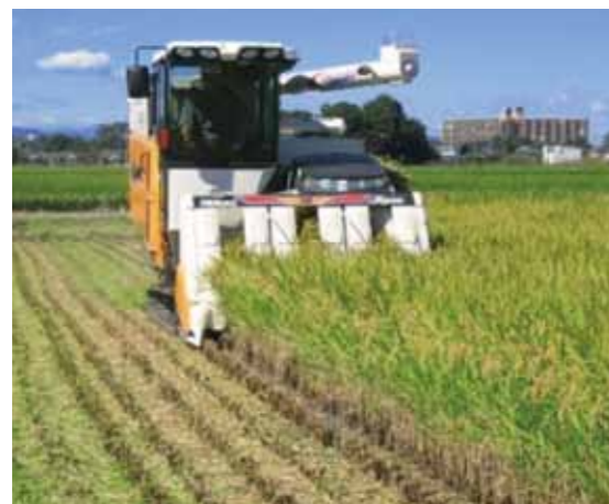
担い手への農地の集積

このため、本市では今後の地域農業のあり方や地域の中心となる経営体を定めた 人・農地プラン 注1 を作成し、担い手への農地の集積や新規就農者への支援を推進するとともに、認定農業者の育成や集落営農組織の法人化を進める必要があります。