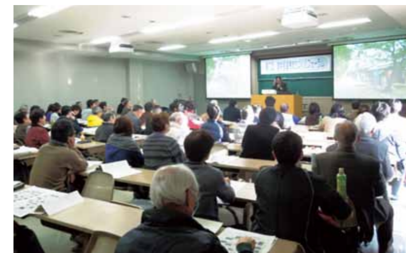
産学官連携まちづくりフォーラム