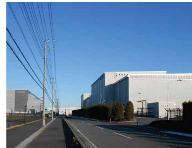
企業立地が進む妻沼西部工業団地