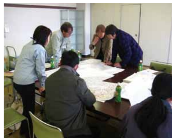
「人・農地プラン」策定検討会