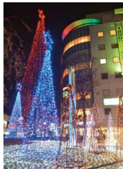
ウィンターイルミネーション 熊谷駅東口広場にて

また、籠原地区や妻沼地区など、周辺商業地では、地域特性を生かし、魅力的な商店街を維持・創出する必要があります。