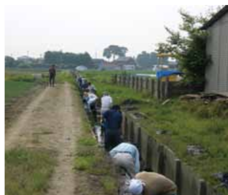
農地・水保全管理支援事業の活動状況