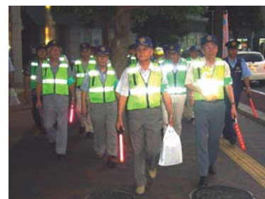
自主防犯パトロール中の自治会の皆さん