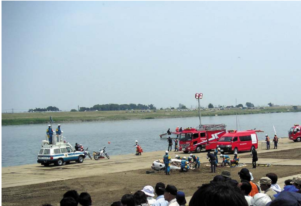
利根川水系連合水防演習の様子