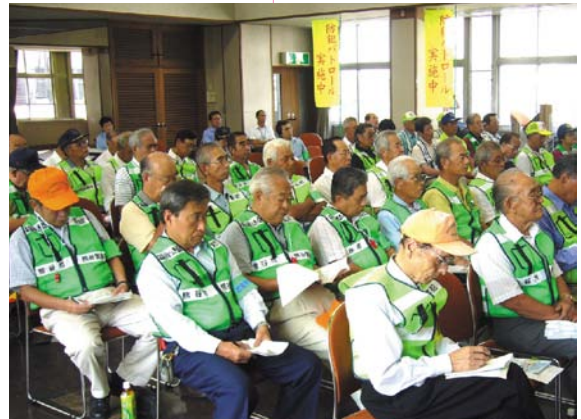
防犯パトロール講習会に参加するボランティアの皆さん

犯罪の防止を図るためには、警察の活動とともに、一人ひとりが自ら犯罪を防止する意識をもって、自らが住む地域に目を注ぎ、地域のつながりを強めることにより、犯罪の「機会」を取り除き、「犯罪の起こりにくい地域環境づくり」を推進する必要があります。