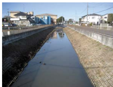
整備が進む新星川