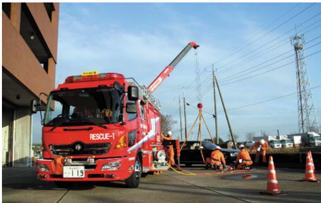
市民の生命、身体、財産を守ります

2004年7月より医療従事者ではない一般市民でも使用できるようになり、病院や診療所、救急車はもちろんのこと、空港、駅、スポーツクラブ、学校、公共施設、企業等人が多く集まるところを中心に設置されています。