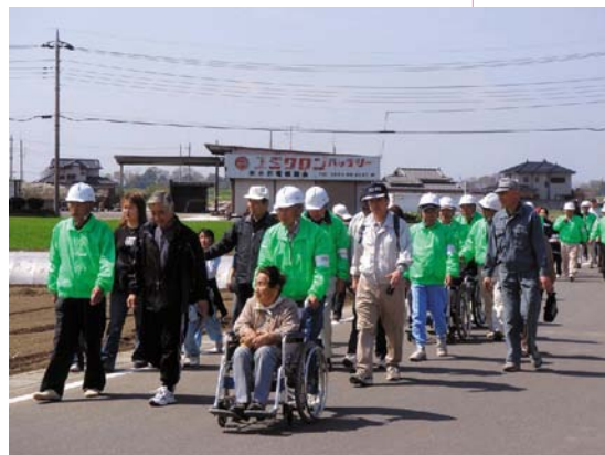
利根川水系連合水防演習の様子