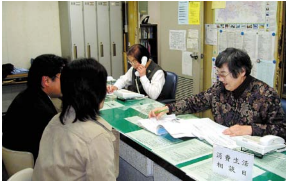
市民相談室内の消費生活相談窓口

このため、消費生活に関する知識の普及や、被害にあった場合の対処方法等の情報提供とともに、相談体制の充実を図る必要があります。