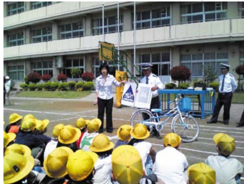
小学生に交通ルールを教える交通安全教室