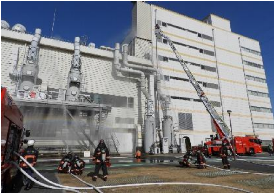
令和8年春季消防総合演習