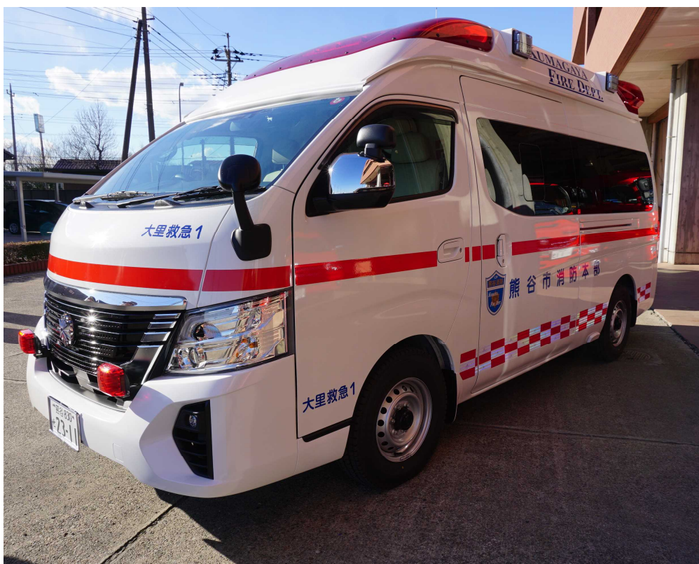
令和5年12月に更新した高規格救急車