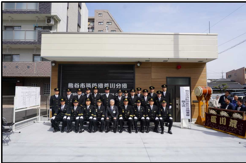
平成30年2月、荒川分団車庫竣工