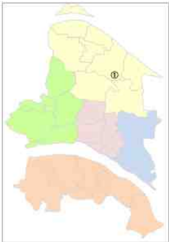
(1) めぬま有機センター