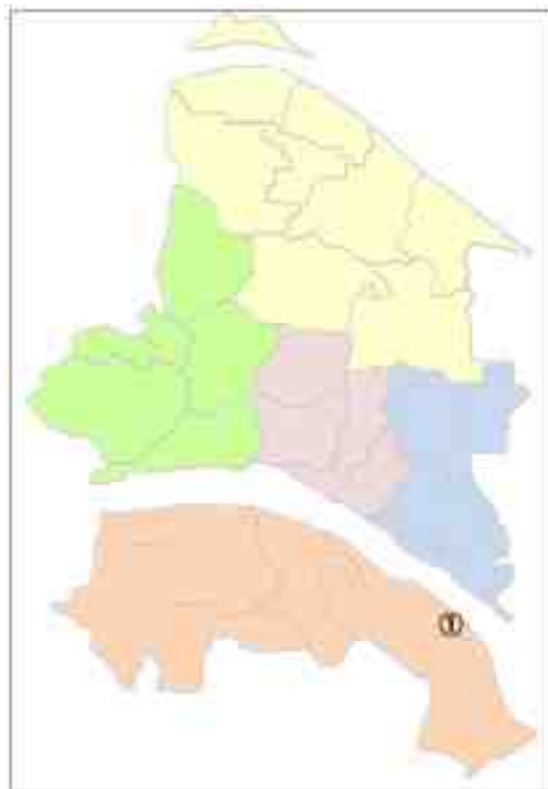
(2) 大里穀類乾燥調製施設