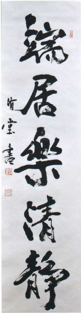
端居樂清静 平成9年