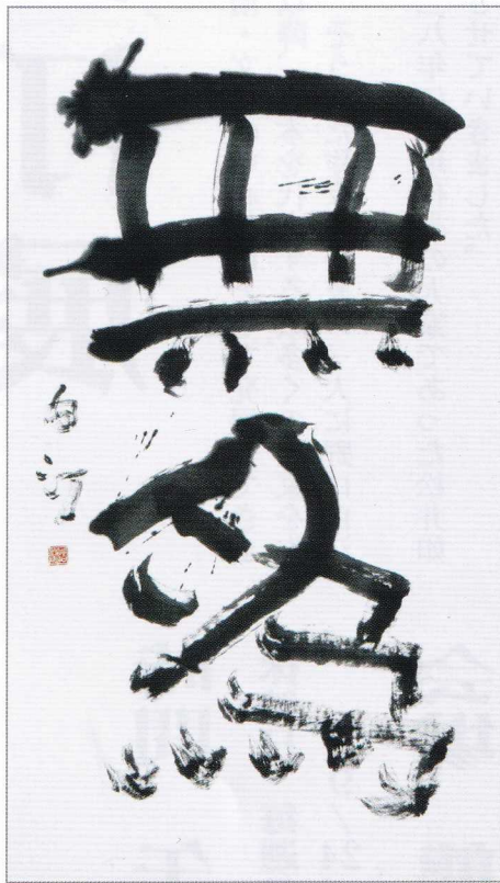
無為 平成11年 第31回日展