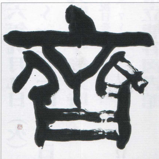
齊 平成5年 個展 (華甲記念)