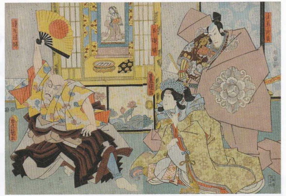
77. 蓮生法師 玉織姫