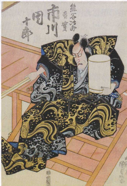
17. 一谷嫩軍記の 熊谷陣屋の場