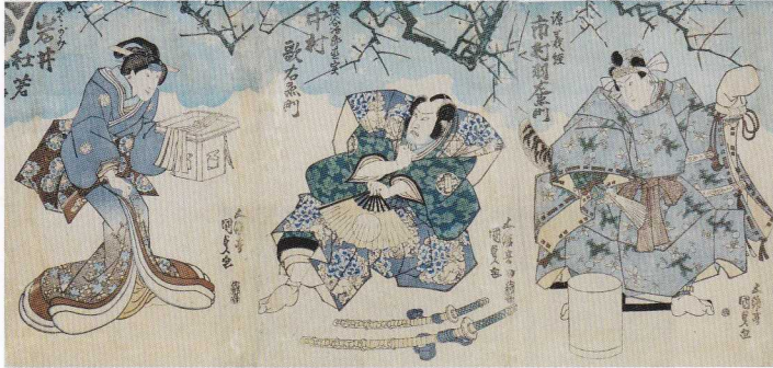
19. 義経と直実、さがみ