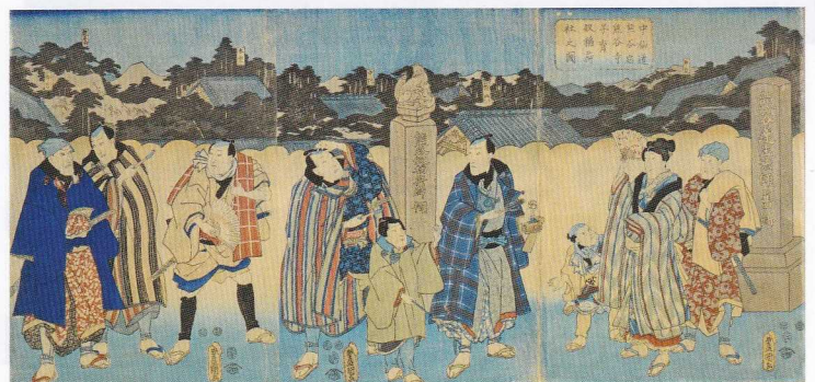
56. 中山道熊谷宿熊谷寺子育奴稻荷社之図