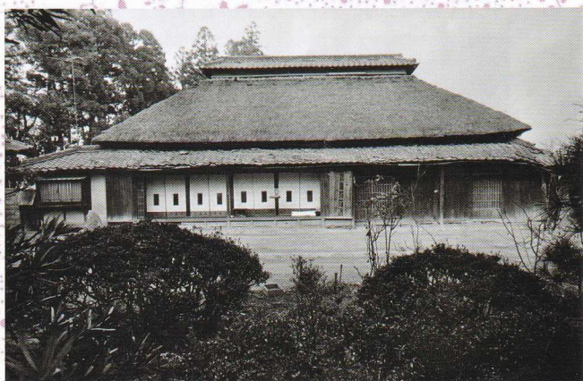
農家 (東別府) 昭和56年