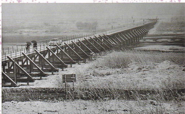
雪の冠水橋 (久下) 平成7年