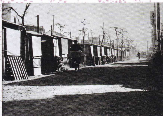
屋台店のある星川 昭和38年