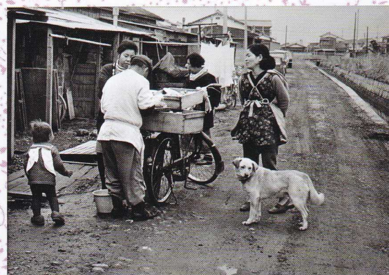
行商(赤城町) 昭和46年

今回の展示では、当館の所蔵品から昭和を中心としたなつかしい日常を写した作品を展覧いたします。時とともにその価値が増す北熊市の作品について知っていただければ幸いです。