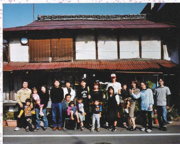
2・3年の歳月 (2枚1組) 昭和56年、平成16年