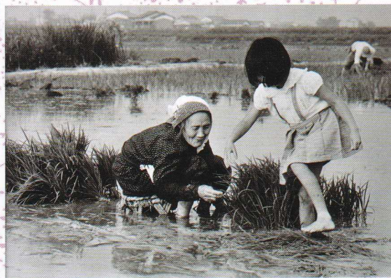
田植風景 (柿沼) 昭和46年