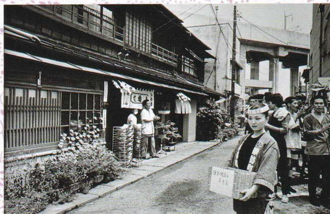
祭りの日 (伊勢町) 昭和57年