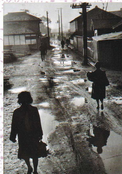
雨上がりの朝 (石原駅へ) 昭和41年