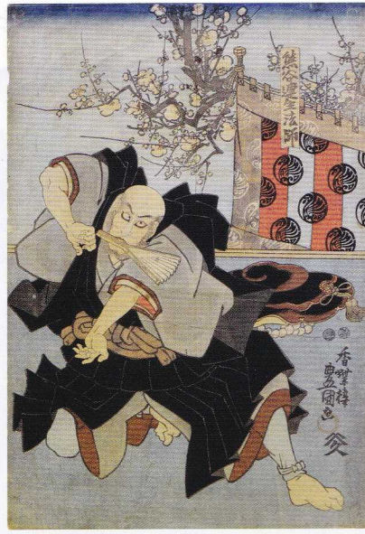
熊谷蓮生法師 歌川豊国 (三代) 嘉永五年