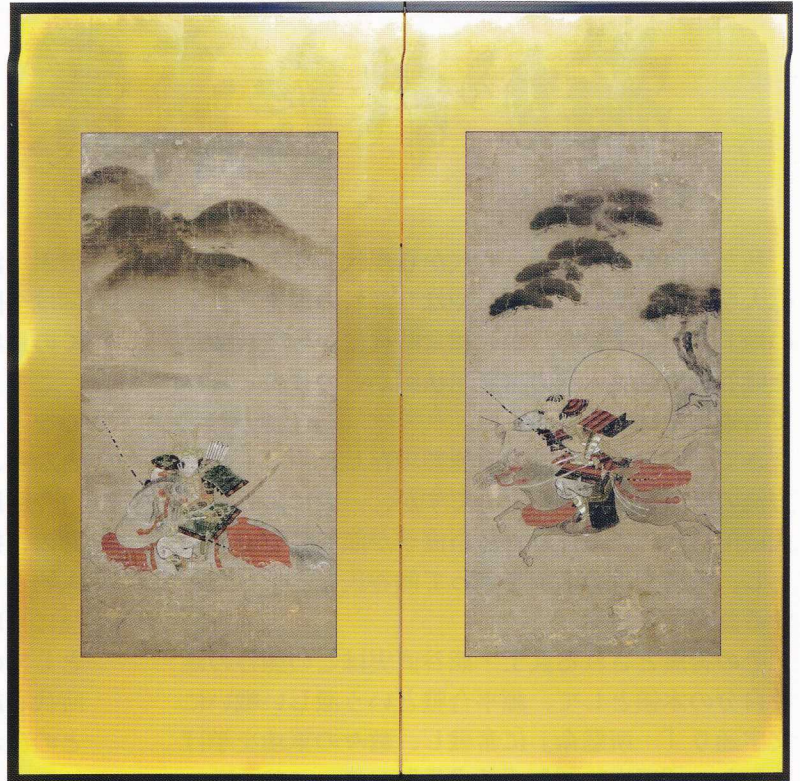
熊谷・敦盛図屏風 狩野派 江戸中期