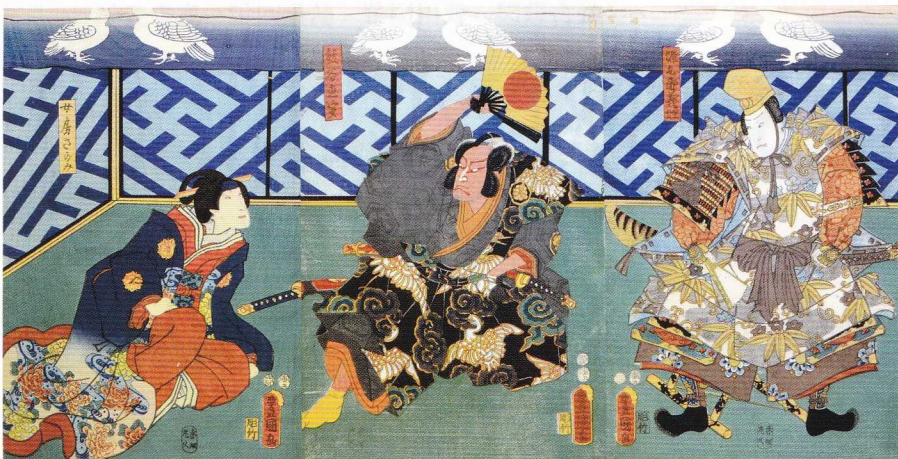
熊谷陣屋 歌川豊国 (三代) 安政元年