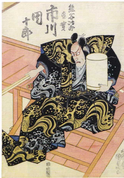
一谷嫩軍記 熊谷陣屋 歌川豊国 (三代) 天保二年