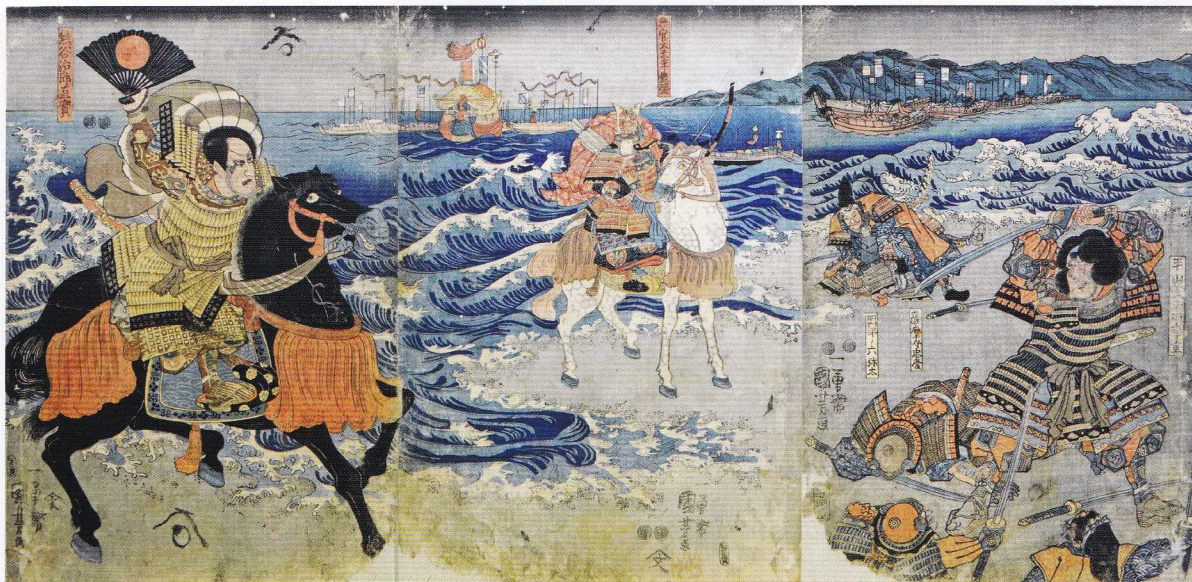
一ノ谷合戦図 歌川国芳 弘化四年～嘉永五年

このように様々に取り上げられた直実・蓮生をご覧いただき、実際に熊谷に住んでいた偉人をもっと身近に感じていただければと思います。そして熊谷への郷土愛を深めていただければ幸いです。