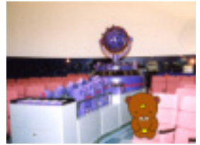
あけまして おめでとうございます

今年の干支は辰。それにちなんでりゅう座をご紹介します。 そして今年、2024年はどんな天文現象が見られるでしょうか？