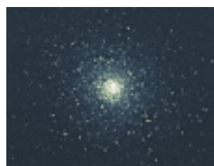
M5 （へび座の球状星団）

観察する天体は予告無く変わることがあります。 危険防止のため未就学児の参加はご遠慮ください。