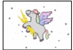
稲妻を運ぶペガサス

神の国・オリンポスで大神ゼウスの武器・稲妻を運んでいた、 天馬ペガサス。ある日、ベレロホーンとともに怪物退治にのり出 します。が、うまくいったその先に待っていたのは・・・？