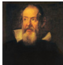
ガリレオ・ガリレイ