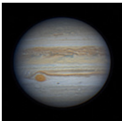
木星 ※2020年撮影

太陽系第5惑星・木星が11月3日に衝 しょう をむかえます。衝とは、地球から見て太陽と正反対の方向に惑星が来るときのことをいいます。衝のころは、宵のころ東の空から昇り、真夜中に南の空を通り、明け方に西の空に沈んでいくので、ほぼ一晩中見え、観察の好機となります。今シーズン、木星はおひつじ座方向でマイナス3等の明るさで輝いています。