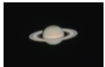
土星 ※2022年撮影