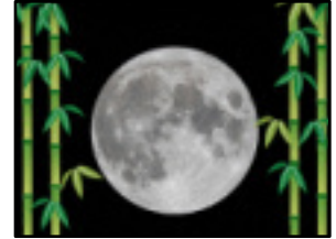
月を語り、月を詠む