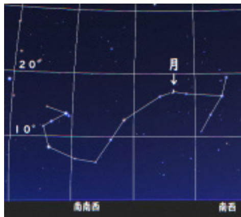
出現予報時刻の月とさそり座

9/21に、さそり座の1等星・アンタレスが月にかくされる「アンタレス食」が起こります。