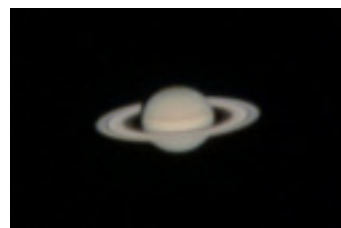
土星 ※2022年撮影