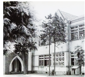
昭和懐古・石原小学校 (S54)