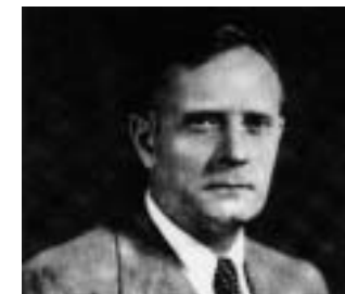
アンドロメダ銀河の距離を測った エドウィン・ハッブル