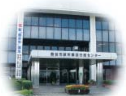
妻沼行政センター