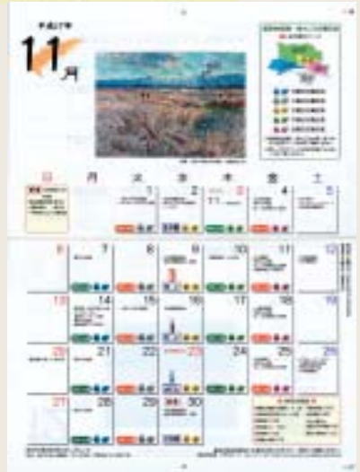
平成17年度版熊谷市くらしのカレンダー

ください。採用させていた場合は、あらかじめ広報広聴課で撮影します。応募方法 題名 掲載を希望する月 題材の場所 熊谷市とのゆかり等 所 氏名 年齢 性別 別 電話番号を記入した紙を写真の裏面に貼付し、広報広聴課まで直接持参するか郵送してください。なお、応募写真は原則として返却しません。