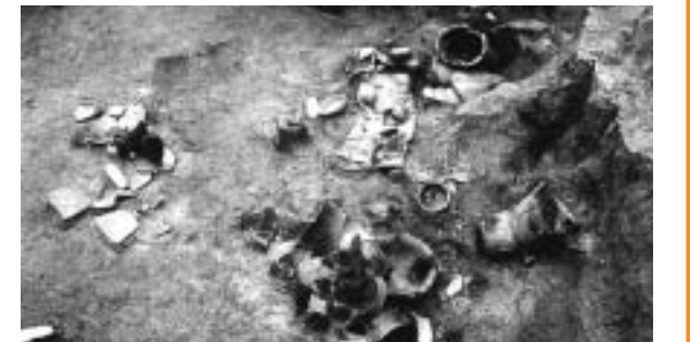
東浦遺跡2号住居跡遺物出土状況

の使用を終了する際の儀式が行われた可能性を示しています。またカマド脇からは、甕に甑(今のセイロ)が組み合わされた状況で検出されたものもあります。