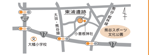
発掘調査が終了したため、現在は施設の建設が進められています。

住居跡以外には、梵字による阿弥陀三尊の表された板石塔婆の埋納された土坑も検出されています。この板石塔婆に刻み込まれた年号は「應仁六」と読むことができますが、應仁は二年までしか存在していません。