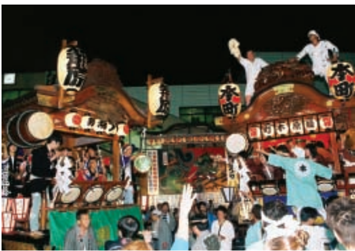
お二人に馴染みの深い「籠原新堀八坂祭」

小野寺 そうですね。いつ聞いても「あ、やっぱりすごいな」って思えますもんね。 市長 やはり、ふるさとへの思い出