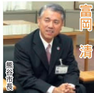
熊谷市長 富岡 清