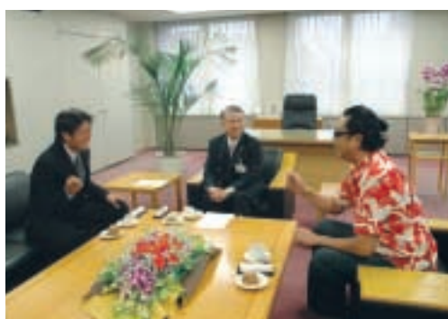
和やかに座談会は進む

司会 昨年熊谷市では、新名物のかき氷「雪くま」や日本最高気温40.9度を記録したと等のニュースが連日のようにテレビ等で紹介され、熊谷市の名を全国に知らしめるきっかけとなりましたが、お二人からも、今後の熊谷市のイメージアップのために何かよいご意見がありましたらお聞かせください。