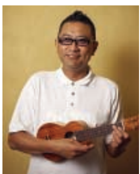
ウクレレを弾くトムさん

「だの「うー」だの言うところが恥ずかしいと思ってしまいますが、私は堂々と使っていくべきだと思います。」