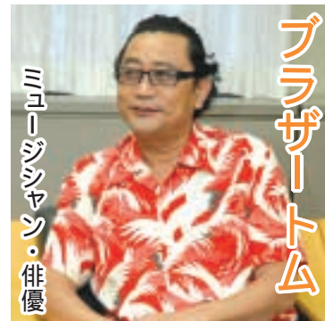
ミュージシャン・俳優 ブラザートム