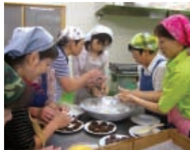
9月28日 手作り 炭酸まんじゅう教室 農業活性化センター 「アグリメイト」で、地粉を使った手作りまんじゅう教室が開催されました。

200年以上前から伝わる伝統芸能で、今年も保存会の皆さんにより八幡神社に獅子舞が奉納されました。