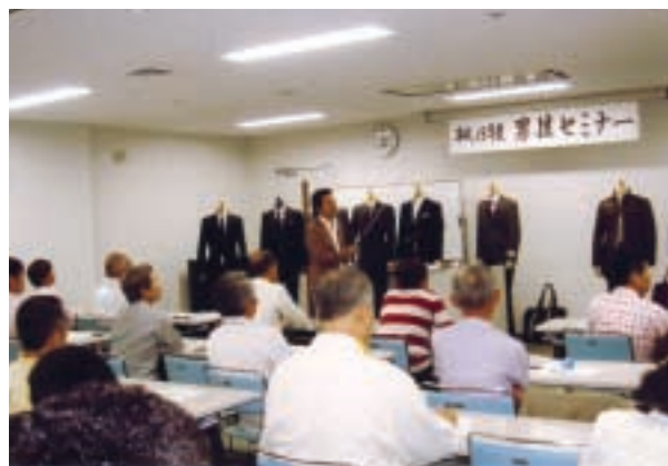
9月29日 男性セミナー

ニュージーランドの姉妹都市インバーカーギル市のサウスランドボーイズ高校、サウスランドガールズ高校の生徒と関係者が熊谷を訪れ、富岡市長を表敬訪問しました。