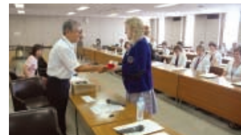
9月20日 サウスランドボーイズ高校、 サウスランドガールズ高校市長表敬