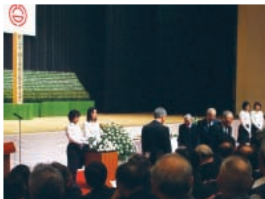
10月12日 熊谷市戦没者・戦災死没者追悼式

「ストップ！交通事故!!」を目標に、商工会館で出発式が行われた後、市役所前で街頭啓発を行いました。