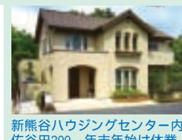
新熊谷ハウジングセンター内 佐谷田200、年末年始は休業

《応募方法》ハガキまたはEメールに、クイズの答え・住所・氏名・年齢・電話番号・今月のテーマ「来年こそは！」についてのコメントを必ず記入の上、11月22日(木)までにご応募ください(1人につき1通) (Eメールアドレス) kohokocho@city.kumagaya.lg.jp なお、市内の商店・企業を知っていただくという趣旨で、当選者にはプレゼント引換券をお送りしますので、お店で引き換えてください。当選者の発表は、引換券の発送をもって代えさせていただきます。