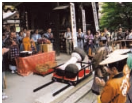
10月7日 第18回 太田松茸道中

江戸時代に行われていた「松茸道中」にちなみ、太田市の大光院を出発した当時の思わせる出で立ちの一行が、妻沼聖天山まで松茸を運びました。