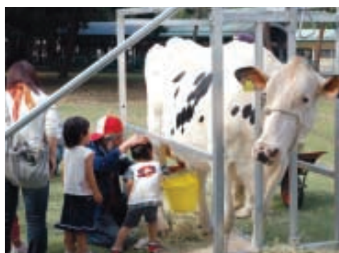
10月13日 彩の国畜産フェア2007

戦争で犠牲になられた方々の慰霊と、世界の恒久平和を願うため、追悼式が熊谷会館で行われました。