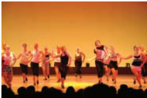
インバーカーギル市のダンススタジオによるジャズダンス

江戸時代に行われていた「松茸道中」にちなみ、太田市の大光院を出発した当時の思わせる出で立ちの一行が、妻沼聖天山まで松茸を運びました。