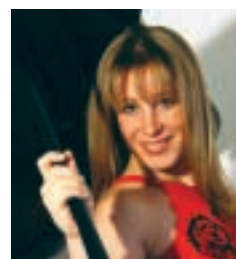
イングリット・フリッター

とき 9月30日(日) 15:00開演 前売開始 5月31日(木) 料金 全席指定3,000円 高校生以下2,000円 曲目 ショパン/幻想即興曲、ラ フマニノフ/練習曲集「音の絵」 からイ短調 ほか