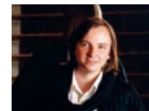
ウラジミル・ミシュク

1990年第9回チャイコフスキー 国際コンクール第2位。 1989年全ロシア・ピアノコンク ール優勝。 詩情溢れるピアノの響きと誠実 でひたむきな演奏で充実した演奏 活動を行うウラジミル・ミシュク が奏でる珠玉の名曲の数々。 とき 7月24日(火) 18:30開演 料金 全席指定3,000円 未就学児の入場はご遠慮ください。