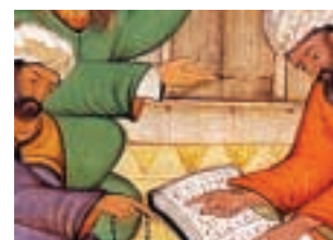
「暦とインド数学の関係は?」

「小惑星イトカワ物語」 投影期間 5月6日(日)まで 「太陽暦の長い道・パート2」 投影期間 5月12日(土)~7月8 日(日)