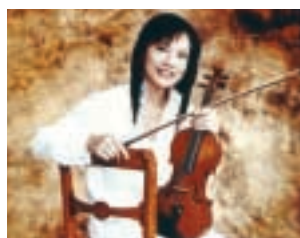
千住真理子

とき 6月23日(土) 18:30開演 料金 全席指定4,000円 曲目 ブラムス/ハンガリー舞 曲第5番 ほか