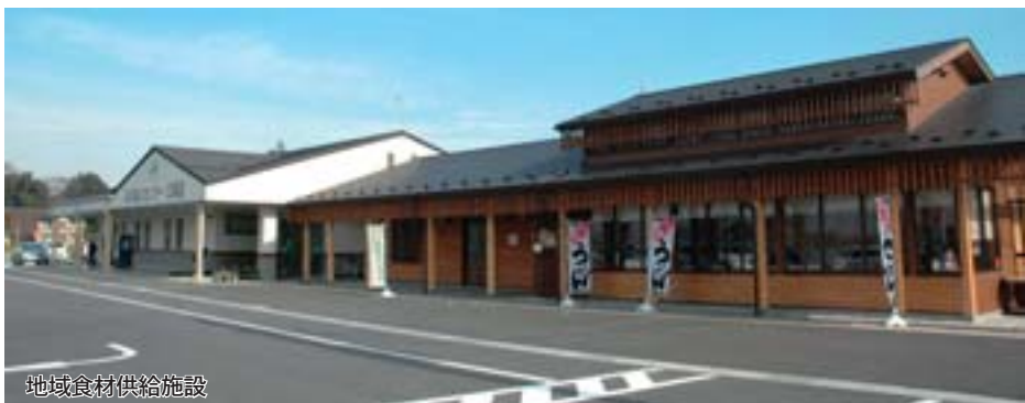
地域食材供給施設