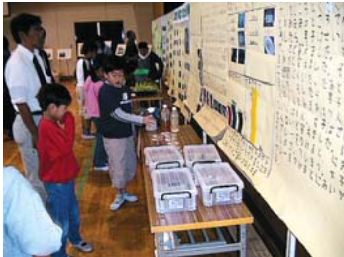
発表会の展示コーナー(長井小)

や地図に表しました。旧福川、道閑堀、福川、奈良川、新奈良川、農業用水路の水質を調べましたが、CODや窒素酸化物は高い数値を示し、水の汚れが進行していることがわかりました。