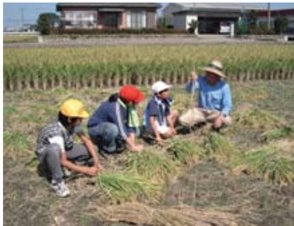
実りの秋を迎えて(市田小)