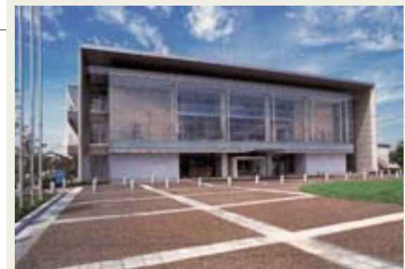
江南町役場(合併後:江南行政センター) ㊟536-1521 江南中央1-1 江南行政センター内には、総務税務課、市民環境課、福祉課、産業課、建設課、出納室江南分室、教育委員会江南事務所が設置されます。