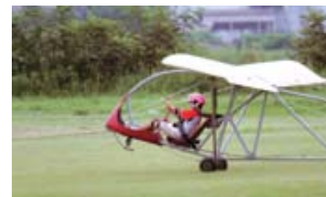
プライマリ・グライダー

※その他の勤務条件、サービスの状況など、人事行政の運営等の状況について、条例に基づき市ホームページに掲載していますので、ご覧ください。