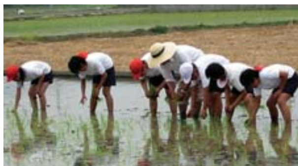
田植えの体験学習(市田小)

これからも、身近な川の観察を続け、家庭排水の量を減らすこと、食用油や調理くずなどを川に流さないことなど、私たちにできることを実行していきたいと思