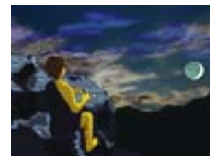
月を観察するクロマニオン人