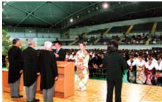
成人の誓いを行う新成人代表