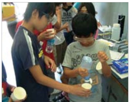
水質検査の体験学習(長井小)

また、この地域の水道水には利根川の下流から取水した水が20%含まれています。このことから、身近な川の汚れはその水を飲む人間の健康に害を与えると考え、地域の川や用水路の水質を調べました。