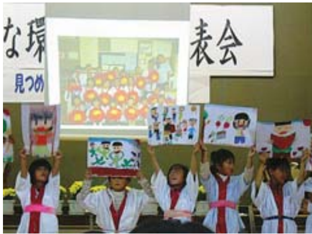
元気に発表できました(秦小)

季節ごとに学校の近くを流れる利根川の土手に出かけ、植物や虫と遊び、自然とのふれあいを通して、自然への関心を高めることができました。また、育てたアサガオの花を押し花にして、発表会の来場者にプレゼントしました。