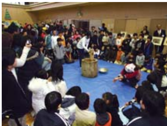
みんなで楽しい餅つき大会(市田小)

また、PTAの積極的な協力により、通学路を清掃する「地域クリーン大作戦」や学校内の環境美化、資源回収を実施しました。