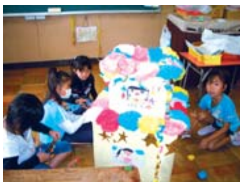
野菜みこし製作(秦小)