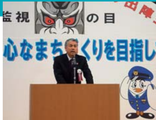
防犯と交通事故防止を呼びかける富岡市長

12月11日 平成18年 年末年始特別警戒出陣式 熊谷スポーツ文化公園で年末年始特別警戒出陣式が開催され、防犯や交通事故防止に向けて、熊谷警察署をはじめ防犯・交通関係団体が一致団結して取り組んでいくことを確認しました。