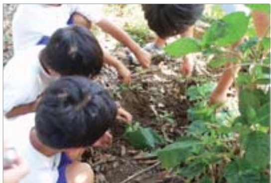
ミミズの採集(長井小)

また、学校の近くの万有製薬株式会社を訪問し、食堂の生ごみ処理施設を見学しました。ここでは、微生物を使って生ごみを分解して堆肥にしています。そこで、いろいろと調べ、「えひめA1-2」という身近な材料で作れる微生物で堆肥を作る方法を試してみました。