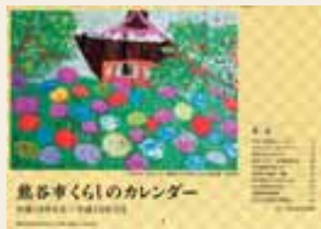
平成18年度版熊谷市くらしのカレンダー