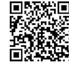
(公財) 埼玉県下水道公社ホームページ