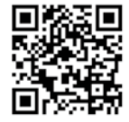
国家公務員採用試験インターネット申込み