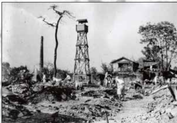
昭和20年8月17日の市街地の様子