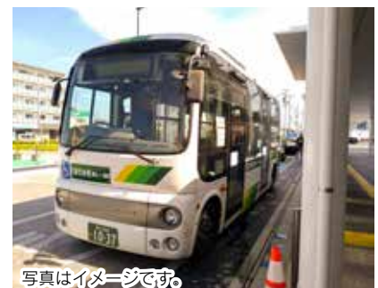
写真はイメージです。

市内のバス輸送交通の利便性向上のため、新たにゆうゆうバス「くまびあ号」を運行します。また、70歳以上の運転免許返納者に対し、路線バス定期券の購入費用の一部を補助します。