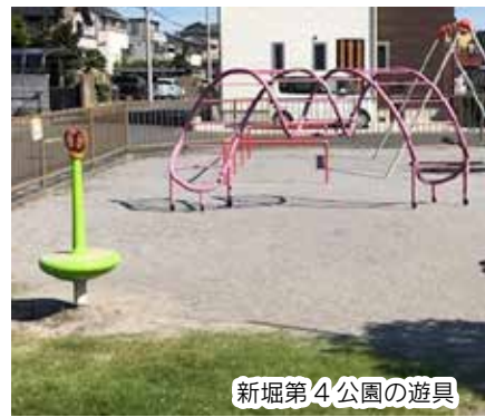
新堀第4公園の遊具