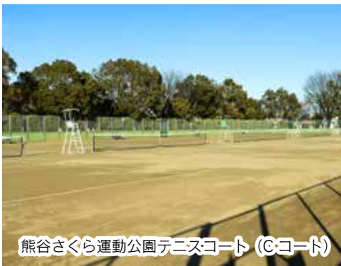
熊谷さくら運動公園テニスコート(Cコート)

利用者の利便性の向上を図るため、テニスコートのコート的人工芝化、バリアフリーに配慮したトイレへの建て替えおよび屋内プールの中央監視盤装置の更新を行います。