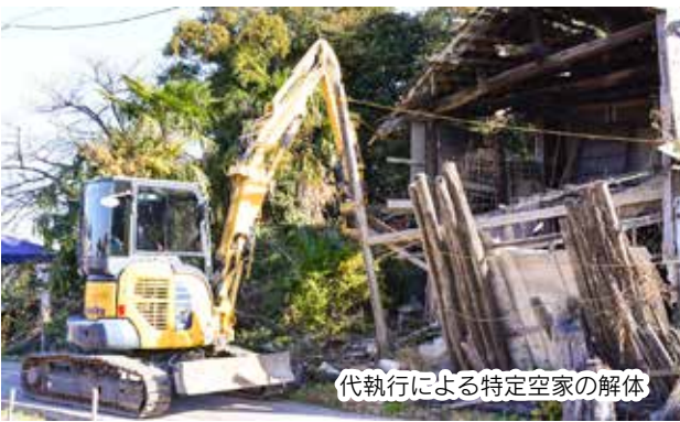
代執行による特定空家の解体

地域の防犯や居住環境の整 備・改善を図るため、特定空 家等に対する代執行等の措置 を行います。また、所有者等 に対し、空き家の除却に要す る費用の一部を補助します。